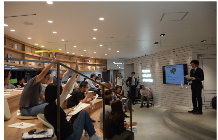
サポートセンター職、営業職向けIPv6セミナー 『2017年度事業報告書』