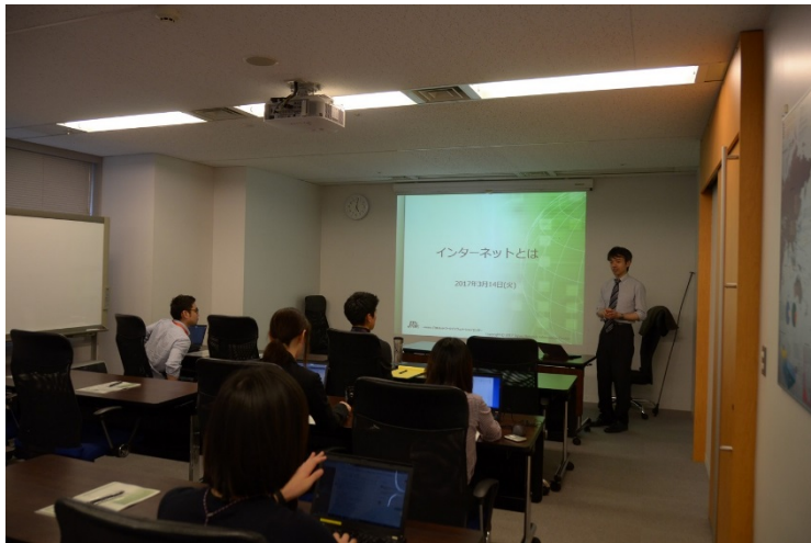
インターネットとは 『2016年度事業報告書』