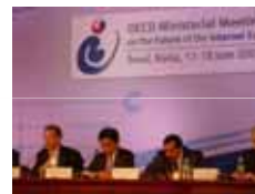
融合セッションの議長を務める増田総務大臣