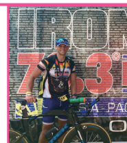
アイアンマン70.3 フイリピン大会に出場