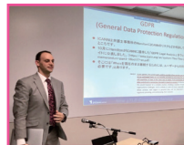
ICANN報告会でのプレゼンテーション

米国ユタ州ソルトレイクシティ出身。2008年から日系ブランドコンサルティング会社にてドメインリカバリー業務、ドメインオペレーションの経験を積み、2009年12月株式会社インターリンクに入社。2010年にレジストリビジネスの新規立ち上げを主導。2013年以降、「.moe」をはじめ、「.osaka」並びに「.earth」の運営と共に、企業ドメイン、レジストラオペレーションを管理している。