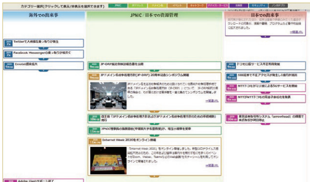
2017～2020年の出来事を追加掲載しました

また、日本のインターネットの歩みを海外の方にも知っていただけるよう、英語版も公開しています。