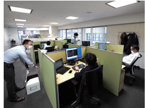
オフィス内の様子