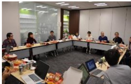
事前情報交換会の様子

国際舞台でご活躍されて得た知見を、ぜひ若手技術者に伝授してください！ 業界全体で国際舞台における日本のプレゼンス向上を目指しましょう！